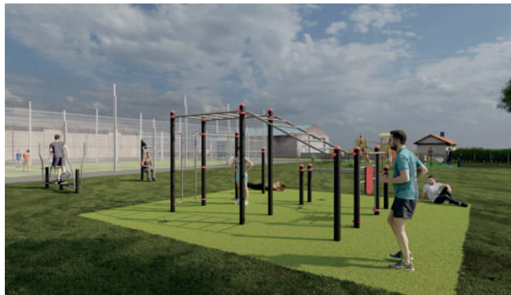
Espace fitness Workout