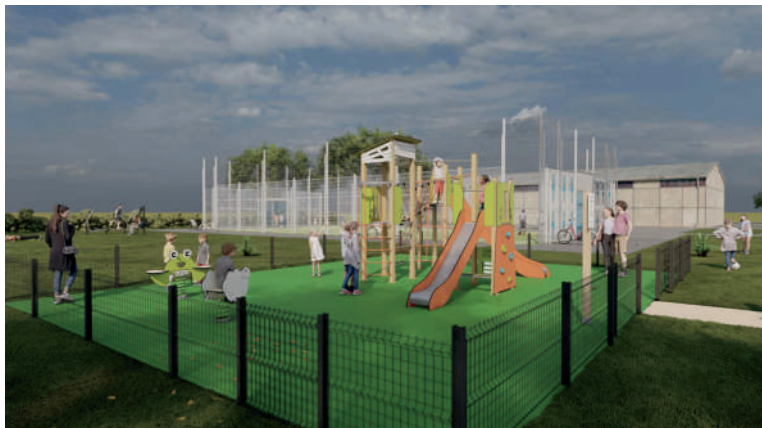
Aire 2-8 ans

L'aire de jeux sera composée d'une aire petite enfance avec accès par portillon sécurisé, plateforme de jeux et jeux à ressort. D'une aire de Fitness - Workout avec plateforme de workout et appareils de fitness. Celui-ci comprend aussi l'aménagement des espaces verts ainsi que la pose d'une table de ping-pong. Des demandes de subvention ont été faites auprès du Département (ADVB), de la Région (FAPL), de la DETR et de Valenciennes Métropole (FSIC). Le reste à charge sera de 20% pour la commune. Sous réserve de conditions météorologiques favorables, le projet devrait être achevé au printemps 2025.